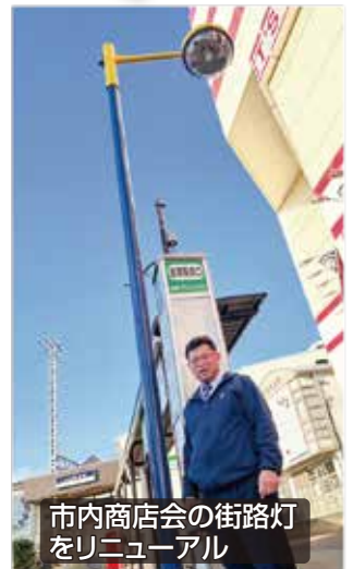
市内商店会の街路灯をリニューアル