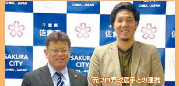
元プロ野球選手との連携